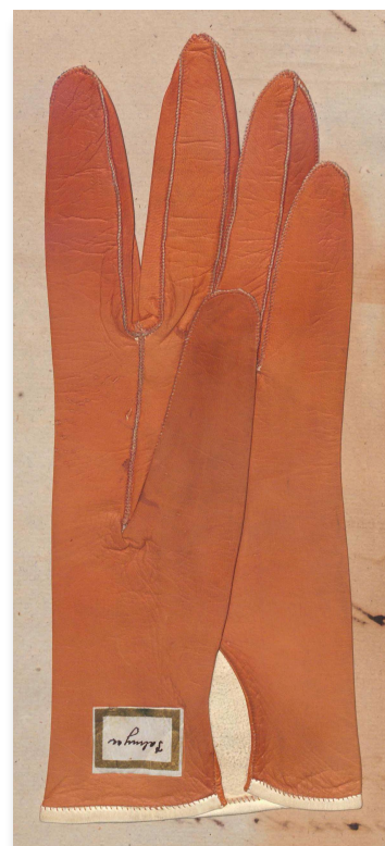
Original sample of a « Palmyre » glove kept in patent file LU127 (ANLux H-0898 (1871/0029))